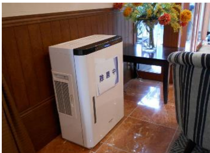
各所に空間除菌装置設置