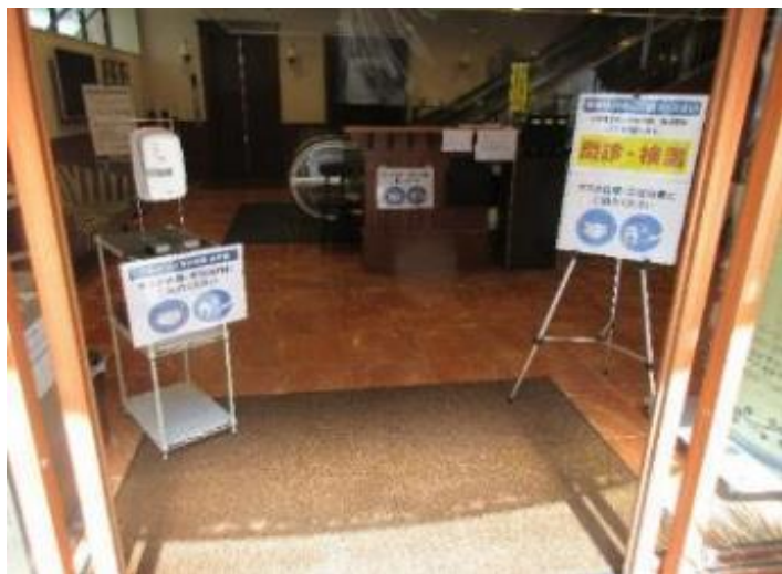
1階入口 アルコール消毒液設置