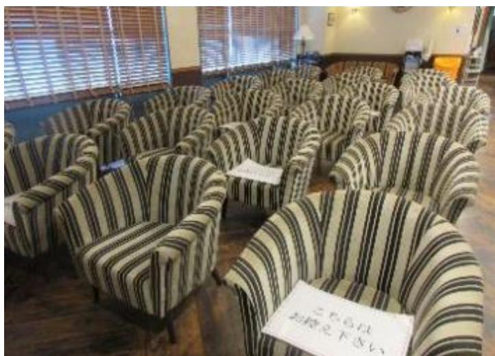
2階待合室間隔を空けてお座りいただく