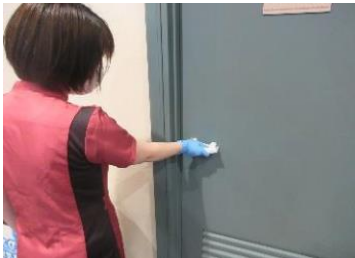
各検査室ドアノブの消毒