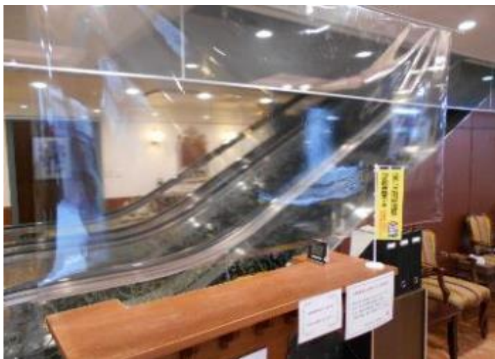
1階受付 ビニールシート設置