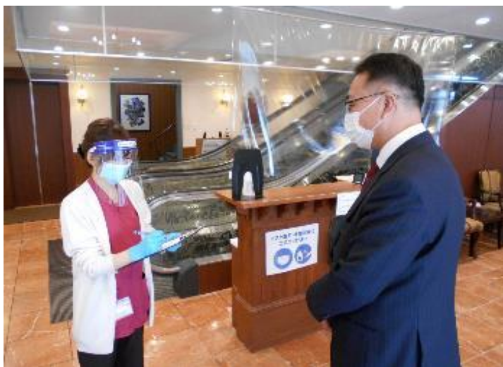
受診者様用問診票の記入