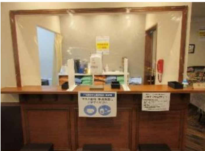
2階受付 ビニールシートとアルコール消毒液設置