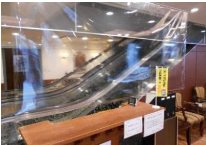
1階受付 ビニールシート設置