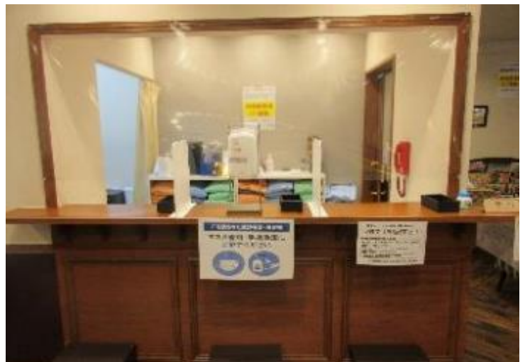
2階受付 ビニールシートとアルコール消毒液設置