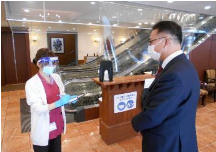
受診者様用問診票の記入