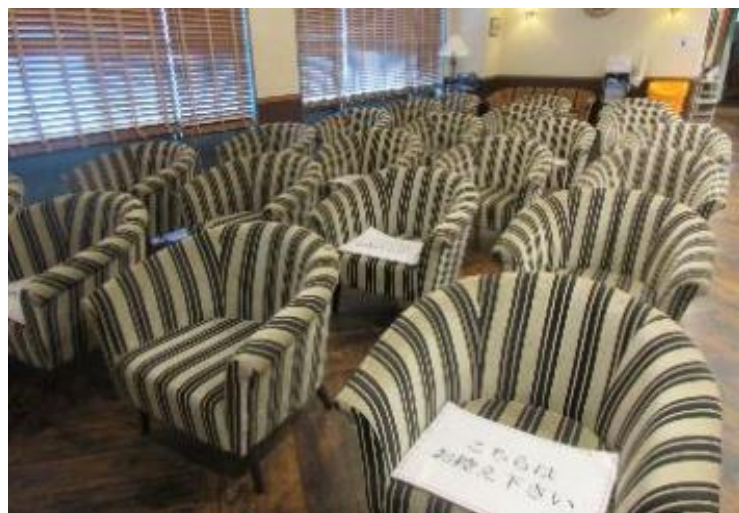
2階待合室間隔を空けてお座りいただく