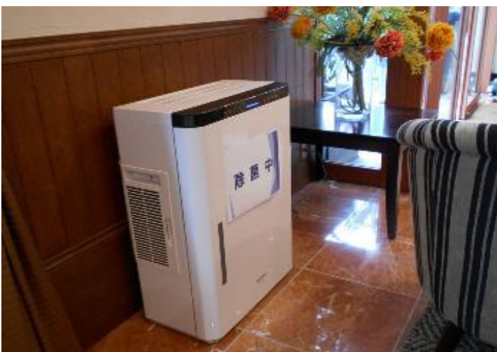
各所に空間除菌装置設置