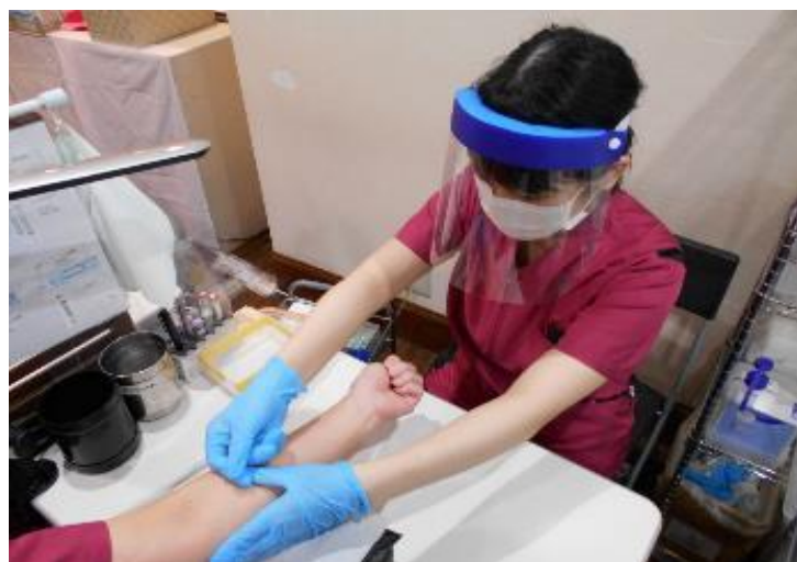
健診時における医療従事者のマスクとフェイスシールドの着用