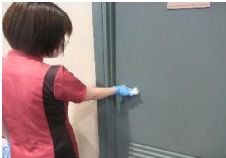
各検査室ドアノブの消毒