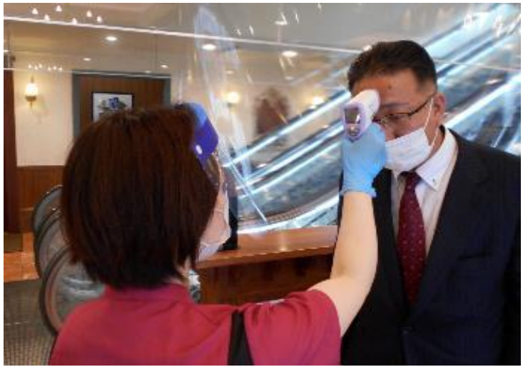
検温状況（非接触型体温計にて実施）