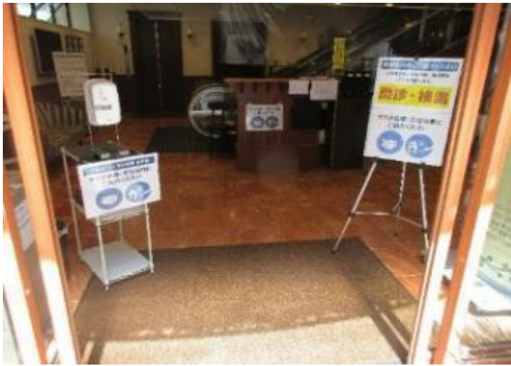
1階入口 アルコール消毒液設置