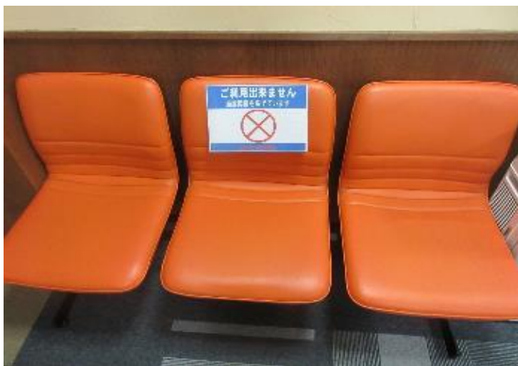
待合室 感覚を空けてお座りいただく