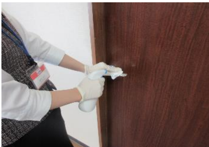
各検査室のドアノブの消毒