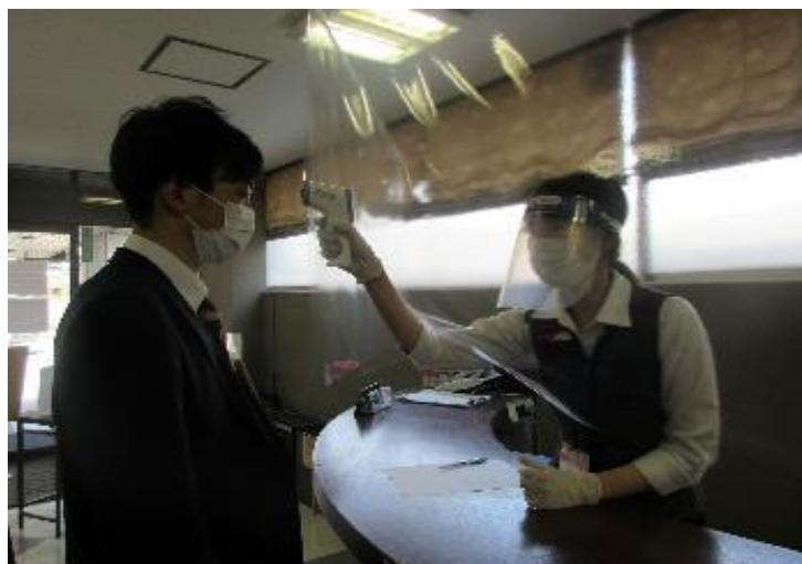
検温状況（非接触型体温計にて実施）