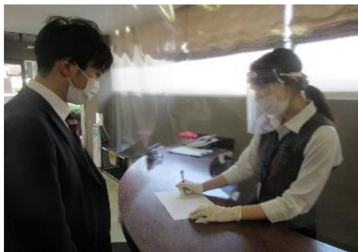
問診票の記入状況