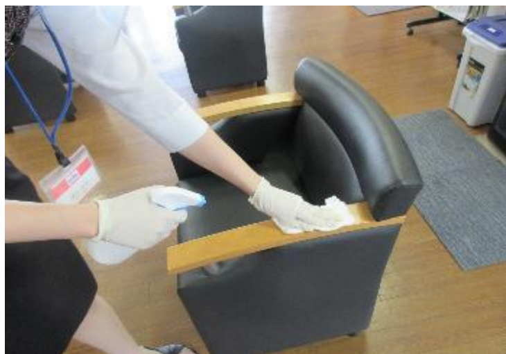
待合室の椅子の消毒