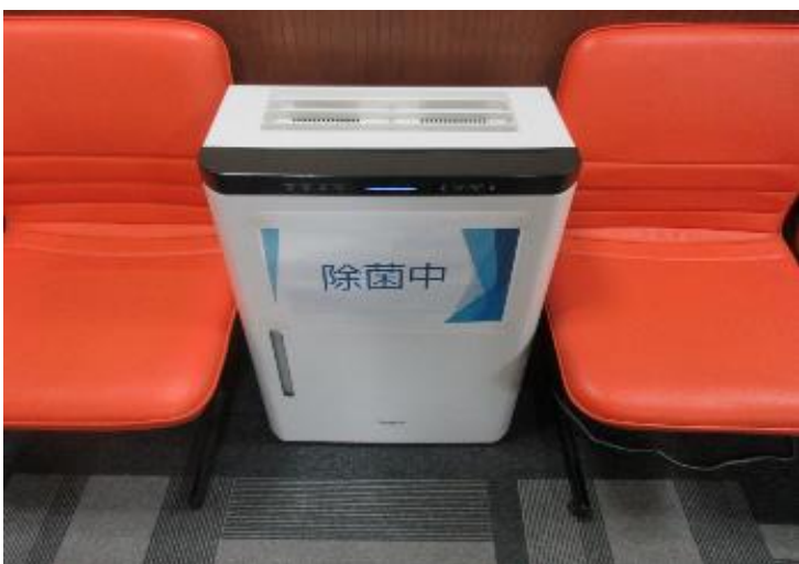
各所に空間除菌装置設置