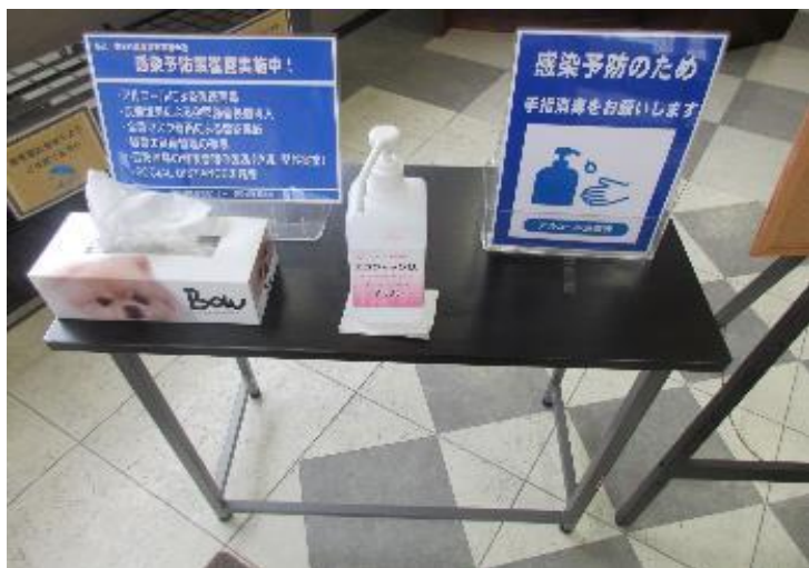
入口 アルコール消毒液設置