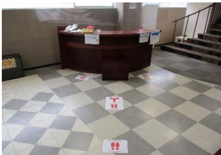
1階受付前 ビニールシート設置